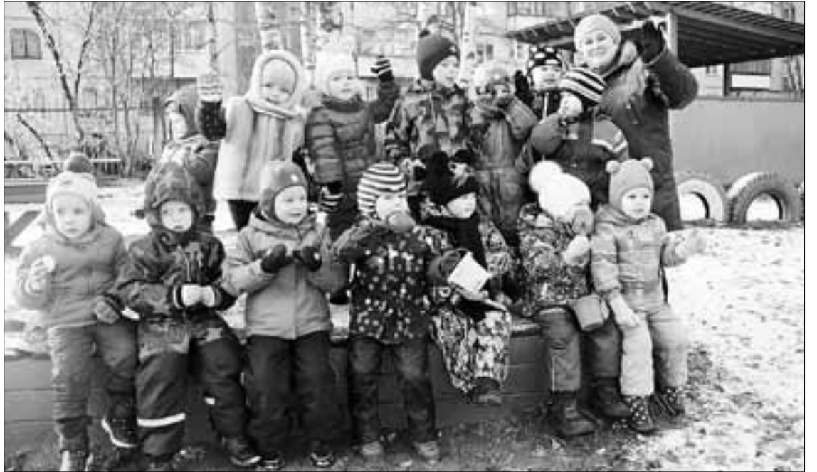
■ На прогулке дружная восьмая группа.