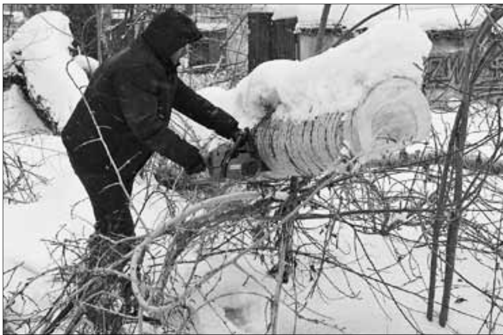
■ Правонарушители занимаются благоустройством территорий.

Эта мера наказания появилась относительно недавно. С 2013 года она стала действовать как санкция