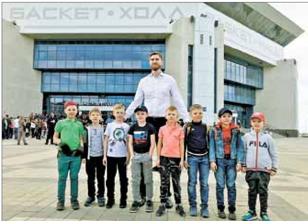
■ Архангельские ребята с Алексеем Саврасенко – титулованным баскетболистом, ныне генеральным менеджером БК «Локомотив-Кубань».

А еще такие выезды – это закалка спортивного характера, психологическая подготовка к соревнованиям. Родители рассказывают, что мальчишки перед турнирами сильно волнуются, не всегда справляются с эмоциями, и им это мешает на поле – показывают меньше, чем могут. Поэтому в планах – продолжить тренировки и съездить на турнир в другой регион.