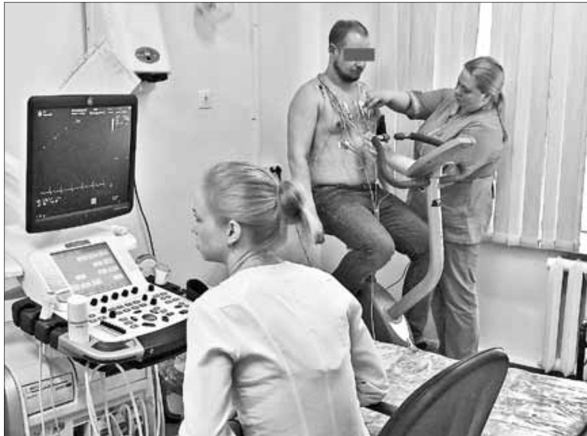
■ В Первой городской больнице внедрена современная методика – стресс-эхокардиография, во время которой сердце обследуют до и после физической нагрузки.

Какие факторы риска развития сердечно-сосудистых заболеваний наиболее актуальны для северян