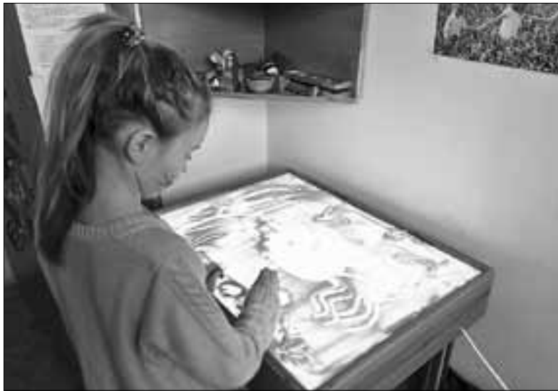
■ Песочная терапия