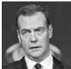
Дмитрий МЕДВЕДЕВ Премьер-министр РФ о новых антироссийских санкциях США