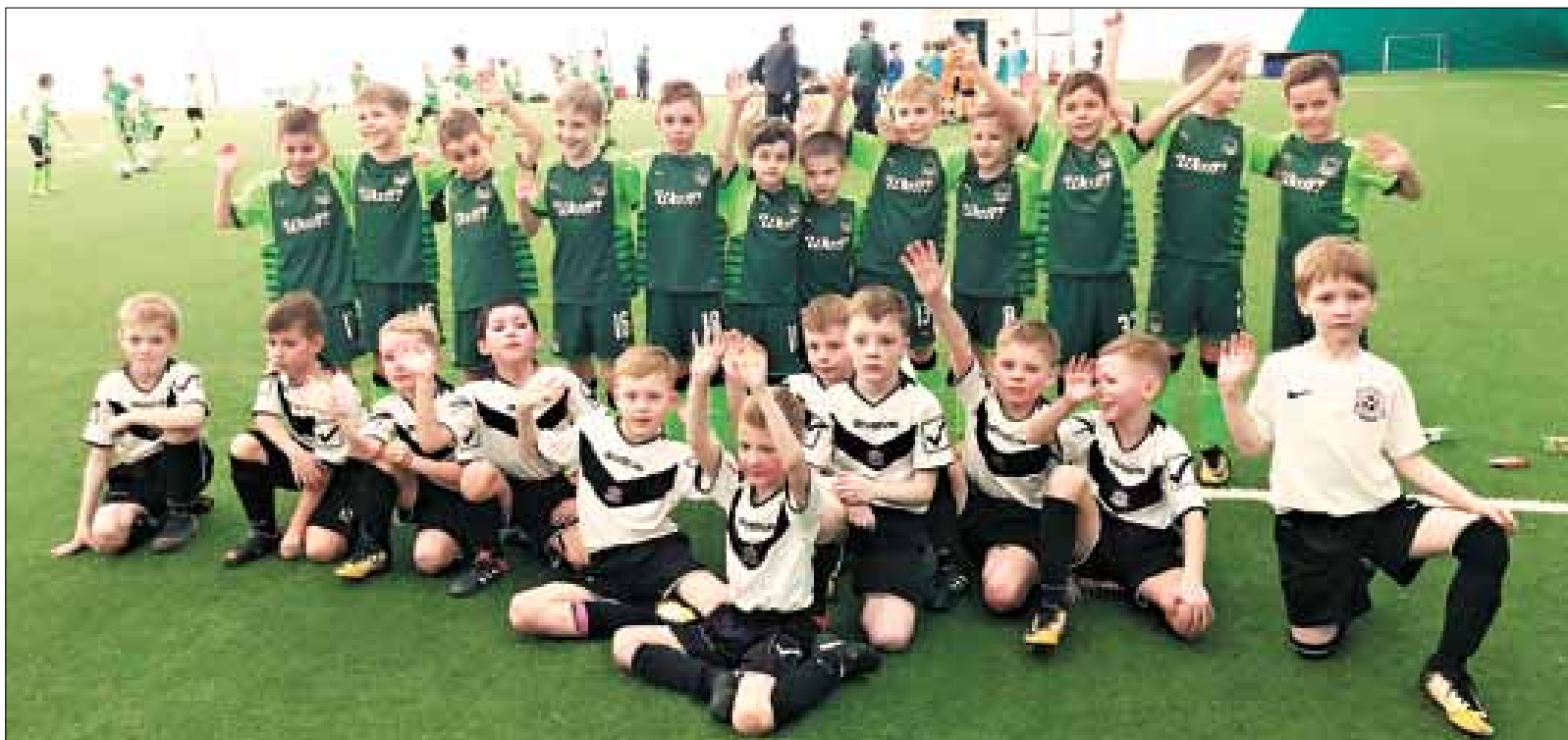
■ Архангельские «олимпик» (в первом ряду) после товарищеского матча с воспитанниками футбольной академии.

Поездка в столицу Кубани запомнилась юным северянам не только тренировками на полях Детской футбольной академии. Они посетили игру футбольного клуба «Краснодар» с «Анжи» в рамках чемпионата России и баскетбольный матч, билеты на который получили из