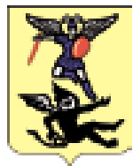
Официальный публикатор муниципальных правовых актов, решений сессий Архангельской городской Думы