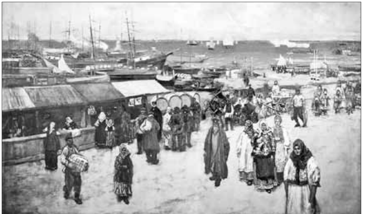
■ Картина Константина Коровина «Базар у пристани в Архангельске»

Наводнившие Архангельск толпы бездомных, голодных и больных крестьян, загнанных сюда не мором и не вражеским нашествием, не стихийным бедствием, а своей («кровной») рабоче-крестьянской властью – вот тот основной фон, на котором отложились мои воспоминания о жизни в Архангельске...»