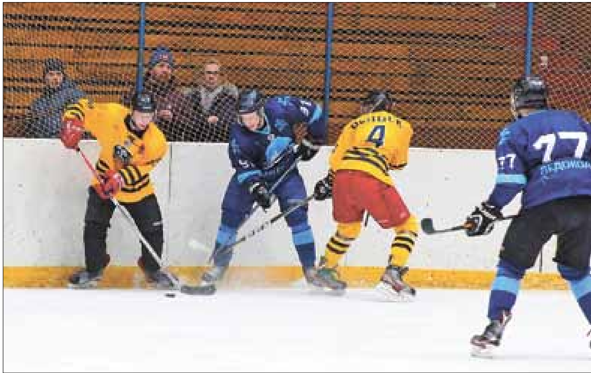
■ Решающее сражение между «Ледоколом» и «Вельском».

– Еще перед стартом турнира обе эти команды являлись фаворитами в своих дивизионах. «Помор» и «Ледокол» представляли Архангельскую область в прошлогоднем Всероссийском фестивале по хоккею среди любительских команд. При этом и «Помор», и