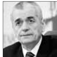
Геннадий ОНИЩЕНКО Депутат Госдумы РФ заявил, что необходимо повышать престиж профессии медицинского работника в глазах общества